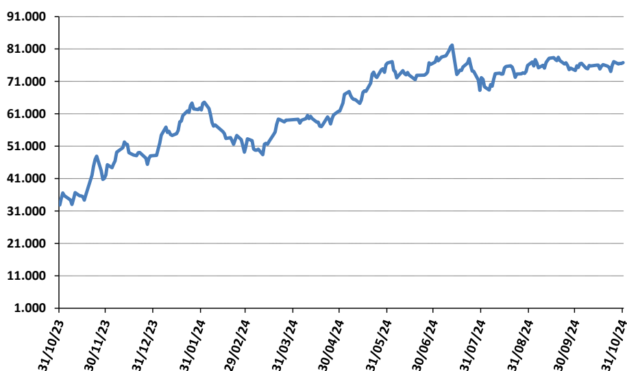
Gráfico 1. Evolución de la cuotaparte en miles de pesos.

La evolución nominal de la cuotaparte, durante el último año corrido al 31/10/2024, muestra un rendimiento del +133,53%, con una variación efectiva mensual equivalente al 7,32%. El YTD hasta octubre de 2024 alcanzó un rendimiento acumulado del +59,89%, y durante el último trimestre el rendimiento fue del +6,44% t/t.